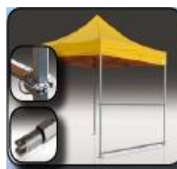
Barres de renfort