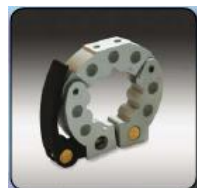
Collier simple et double