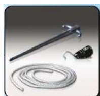
Kit-vent piton alu