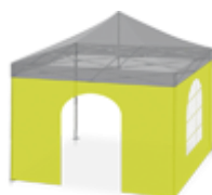
Porte et fenêtre Romane