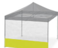
Mur cristal 2/3 panoramique