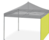
Mur bâche pleine