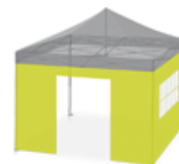
Porte et fenêtre standard