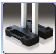
Poids de 15 kg